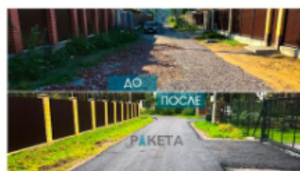
Коттеджный поселок "Памир" Сертоловское городское поселение