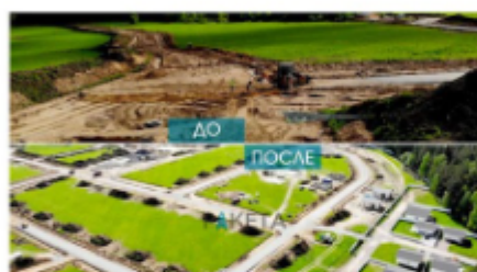
Клубный поселок Нурми Хиалс Раздольевское сельское поселение