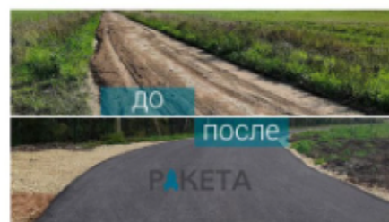
Сельхоз предприятие пос. Суйда