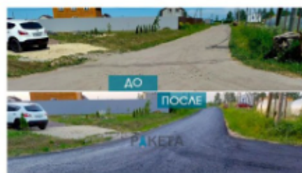
Коттеджный посёлок Лесная Привилегия Виллозское городское поселение