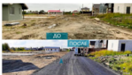
Коттеджный посёлок РедВилл Колтушское сельское поселение