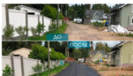
Коттеджный поселок Академические дачи пос. Смолячково